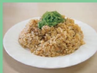
今回UDレシピ料理会で作った品がこちら★